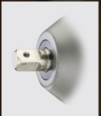
Through Hole Type