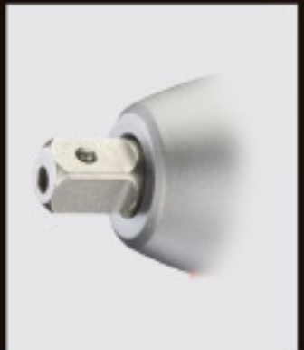
Pin Detent Type