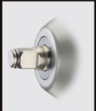
Friction Ring Type